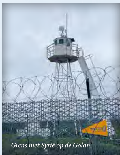
Grens met Syrië op de Golan

herkenning. Als commissie gaan we ons beraden over het vervolg. Rond het middaguur hebben we het Messiasbelijdende verzorgings-tehuis Eben-Haëzer in Haifa bezocht. Een mooie ontmoeting met een aantal bewoners en de directeur, waarbij ons een lunch werd aangeboden. Voor en na de lunch zongen medewerkers en bewoners onder begelei-