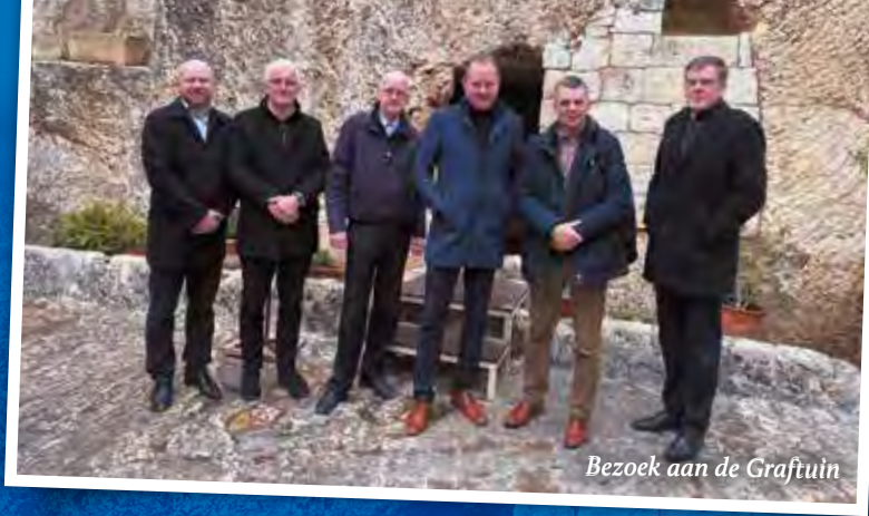
Bezoek aan de Grafuin